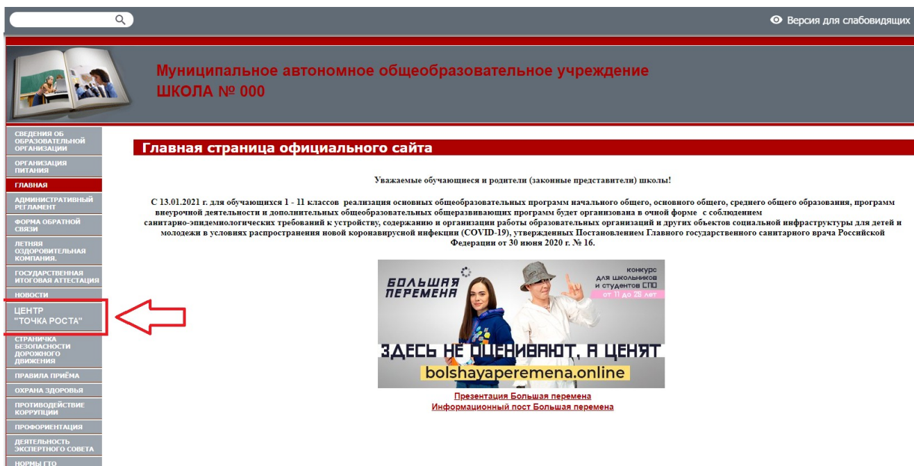
Рисунок 2. Пример размещения ссылки на раздел на сайте общеобразовательной организации

На официальном сайте общеобразовательной организации, в которой создается центр образования естественно-научной и технологической направленностей «Точка роста» (далее – центр «Точка роста», центр) в рамках федерального проекта «Современная школа» национального проекта «Образование», не позднее даты начала функционирования центра (не позднее 1 сентября года создания центра) создается раздел «Центр «Точка роста»». Ссылка на раздел размещается в главном меню сайта общеобразовательной организации и должна быть видима при просмотре каждой страницы. Ссылка не может являться вложенной в другие меню. Пример размещения ссылки на раздел «Центр «Точка роста» в меню официального сайта общеобразовательной организации в информационно-телекоммуникационной сети «Интернет» приведен на рисунке 2.